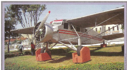
DIGNITY AND ASSOCIATES