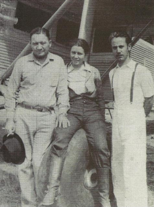
DIGNITY AND ASSOCIATES